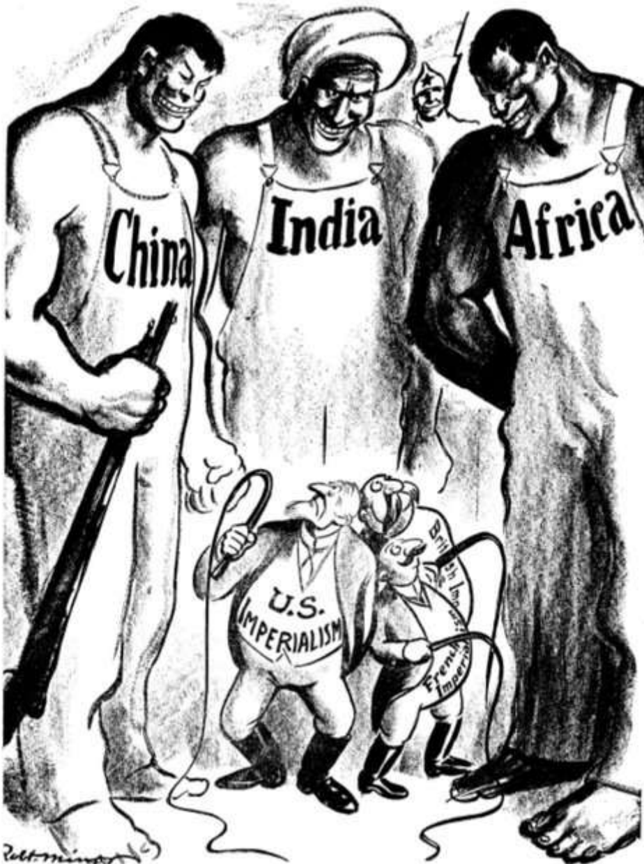
Figure 6. Robert Minor, "On the International Slave Plantation." Daily Worker , June 27, 1925. Caption: Who Is That You All Are Going to Whip, Mr. Legree?

Esa crisis consiste en el intento del Norte Global (categoría que incluye a Rusia) de solventar su pérdida de peso en el mundo por medios militares. Todos sabemos, por ejemplo, que la economía de Estados Unidos, que en 1945 representaba casi la mitad de la economía mundial, hoy solo representa el 15% del PIB mundial. Y que toda una serie de países que entonces no contaban nada, hoy son potencias emergentes que van a más.