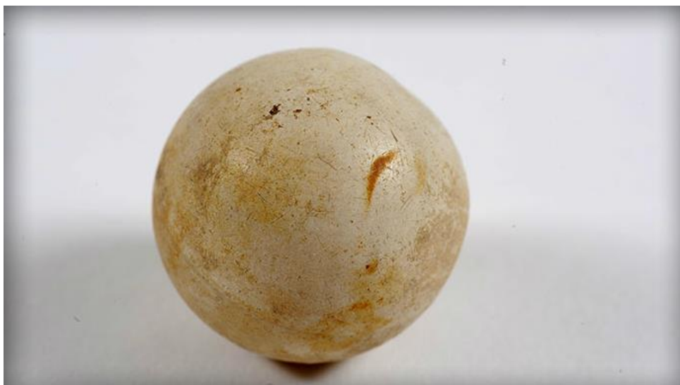
Figura 4. La pelotita de ping-pong hallada por medio de la excavación y trabajo arqueológico en “Club Atlético”.

curar un padecimiento implica poner el caos en estructura, volver conocido aquello que es desconocido. En el caso del ping-pong, el hallazgo de la pelota permitió darle referencialidad al sonido, poner en términos estructurales un hecho que generaba caos en las conciencias.