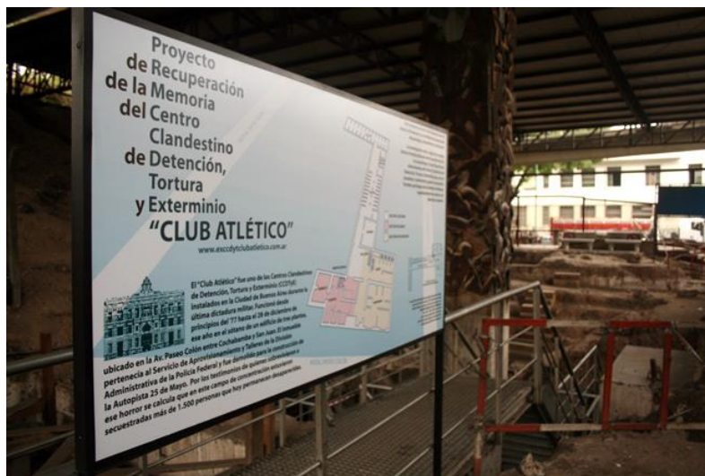
Figura 2. La recuperación de “Club Atlético” por medio del trabajo arqueológico.