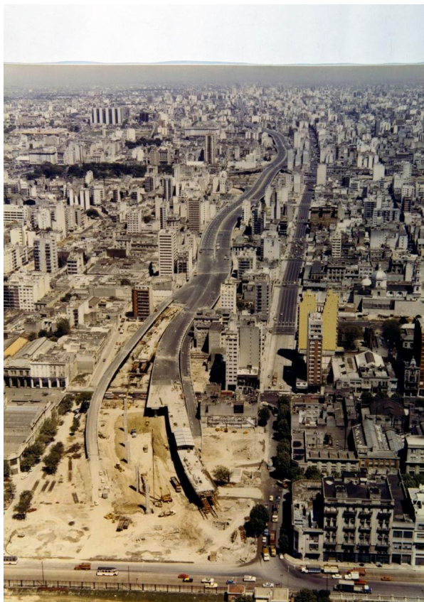
Figura 1. Documento fotográfico sobre la construcción de la Autopista 25 de Mayo y de cómo su trazado implicó el soterramiento del “Club Atlético”.