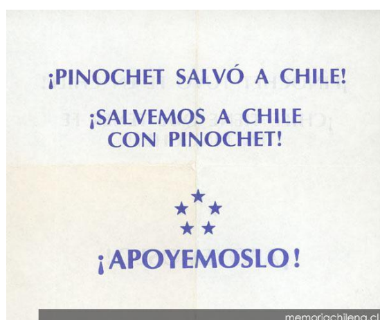
Ilustración 10: Folletos a favor de Pinochet en el referéndum (1988).

Tras la censura de los medios de comunicación, los panfletos, folletos y volantes jugaron un rol central en la política chilena, pese al Decreto Ley N°1009, del 5 de mayo de 1975 que indicaba: “(...) se presumirá autor de propaganda de doctrinas o de propagar o divulgar noticias o informaciones que las leyes describen como delito al que sea sorprendido portando volantes, panfletos o folletos que sirvan para su difusión” 27 . Este decreto no fue suficiente y las calles chilenas amanecían repletas de folletos. Estos panfletos abordaban diversos temas que mostraban la tensión social que reinaba en la sociedad chilena y además denunciaban la violación de los DDHH que realizaba el gobierno. Mientras tanto, otros defendían a Pinochet y su gobierno: