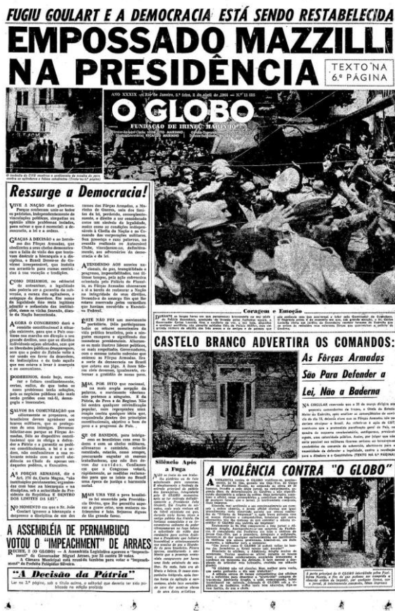
Ilustración 4: Portada del Diario O’Globo. 3 de Abril de 1964.

Una vez finalizada la dictadura, pasaron muchos años hasta que se investigarán los casos de violaciones de los derechos humanos. Finalmente se crea la “Comisión Nacional de la Verdad” en el año 2011, bajo la presidencia de Dilma Rousseff. Su objetivo, al igual que que se realizaron en Chile y Argentina, era emitir un informe sobre la violación de los derechos humanos que comenzó con el Golpe de Estado de 1964. Los familiares y víctimas critican que si bien la Comisión pueda investigar, no pueda castigar a los culpables debido a ley de Amnistía dictada por el gobierno militar en 1979, que continúa vigente. Con respecto a este último punto encontramos una gran diferencia con el gobierno argentino, ya que tras la asunción de Raúl Alfonsín la Ley de Autoamnistía fue anulada inmediatamente. Otro elemento que nos permite relacionar el caso brasileño con el argentino, es el libro “Nunca Mais” de Paulo Evaristo Arns. En este se documentan los episodios que tuvieron lugar durante la dictadura militar de 1964, lo que sirvió de base para las investigaciones posteriores que llevaran a cabo. Finalmente en