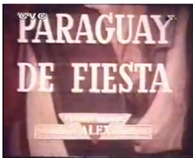
Ilustración 11: Propaganda ante la asunción de Stroessner

A lo largo de la experiencia de la dictadura paraguaya, se usaron los medios de comunicación audiovisuales desde el inicio del golpe de estado. En un video publicado en la televisión que celebraba la asunción de Stroessner, se sostenía que la ciudad de Asunción era un emporio de la paz y el trabajo y califican la llegada al poder del nuevo presidente como el “puro sentir del pueblo en elecciones”, al tiempo que se mostraba al mandatario aclamado por el público junto con la presencia del líder Argentino Juan D. Perón. 32