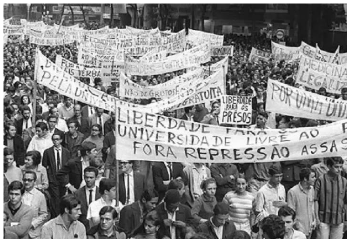
Ilustración 2: Marcha de los Cien Mil (1968)

observar en la Ilustración 2. Esta movilización se conoció como marcha de los cien mil, caracterizada por ocupar el centro de Río de Janeiro para protestar contra la represión y las probables privatizaciones de la educación pública. Estos actos reflejaban una creciente contestación a la dictadura militar instalada con el golpe de Estado en 1964, aunque la respuesta estatal fue de una represión que causó numerosas víctimas. 18 Por otro lado, el gobierno de facto utilizaba como estrategias frases o slogans para legitimarse ante la población y fomentar el exilio de los disidentes, como se puede observar en la Ilustración 3.