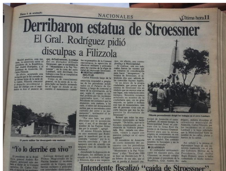
Ilustración 13: Diario Última Hora tras el fin de la dictadura militar (1991)

Otro de los momentos más importantes del periodo dictatorial que cubrió el periodico son los siguientes: El clinicazo de 1986: ya en los últimos años deja la dictadura de Stroessner, fue una protesta sin precedentes: logró unir a todos los gremios del Hospital de Clínicas, los sacó a la calle a pesar de la represión de la policía y convocó un masivo apoyo ciudadano. 36 "Última Hora" también cubrió la visita del Papa Juan Pablo II, en pleno proceso dictatorial. El medio destaca que el Papa enfrentó al régimen en todos los discursos que dio, por lo que su visita provocó que aumentase la conflictividad social que reinaba.