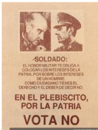
Ilustración 9: Folleto en el marco del Plebiscito de 1988.

te obliga a colocar los intereses de la patria, por sobre los (...) de un hombre. Como ciudadano tienes el derecho y deber de decir no”.