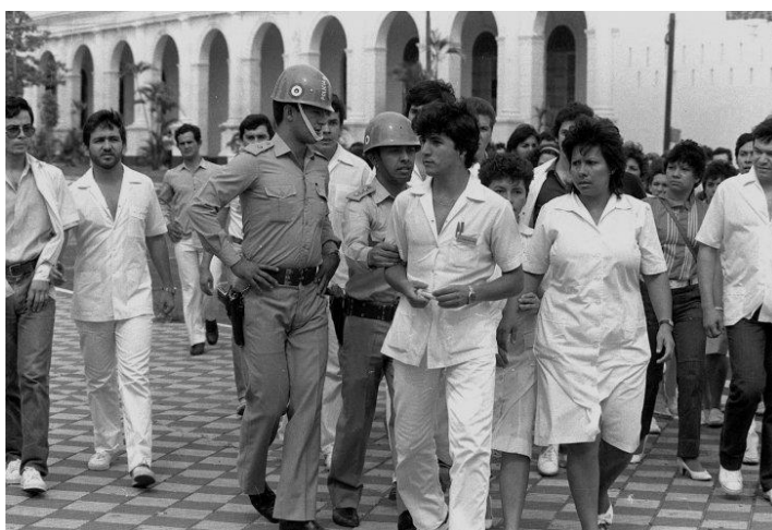
Ilustración 14: El clinicazo (1986)

Otro de los momentos más importantes del periodo dictatorial que cubrió el periodico son los siguientes: El clinicazo de 1986: ya en los últimos años deja la dictadura de Stroessner, fue una protesta sin precedentes: logró unir a todos los gremios del Hospital de Clínicas, los sacó a la calle a pesar de la represión de la policía y convocó un masivo apoyo ciudadano. 36 "Última Hora" también cubrió la visita del Papa Juan Pablo II, en pleno proceso dictatorial. El medio destaca que el Papa enfrentó al régimen en todos los discursos que dio, por lo que su visita provocó que aumentase la conflictividad social que reinaba.