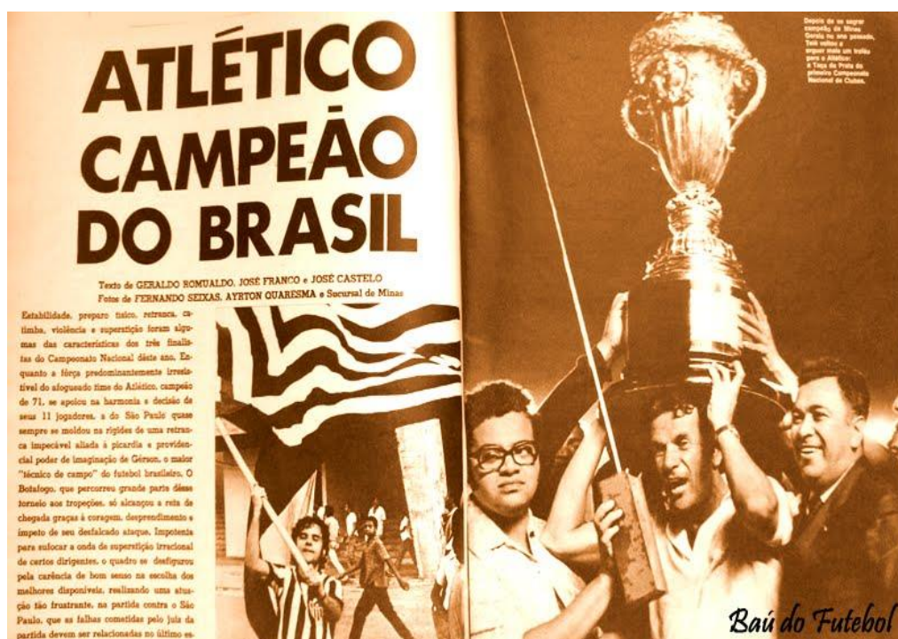
Ilustración 1: Publicaciones periodísticas ante el Mundial de Fútbol de 1971.

Si nos detenemos en los mecanismos de propaganda utilizados por el régimen brasileño para legitimarse, podemos ver que entre las herramientas centrales que utilizó el gobierno militar se encuentra la publicidad, donde canciones de llamamiento cívico eran divulgadas diariamente, así como frases y calcomanías que se repartían en las escuelas infantiles. A su vez, el fútbol también fue utilizado por el régimen para lograr adhesión popular, así fue que en 1971 se estableció el Campeonato brasileño de Fútbol. 17 Todas estas acciones que el gobierno llevaba a cabo, buscaban distraer a la población e insertarla en un clima de optimismo creciente, tal como demuestra la extensa campaña periodística (Ilustración 1).