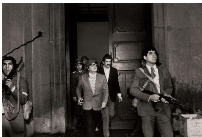
Ilustración 6: Últimos momentos de la presidencia de S.Allende (1973)

Sin embargo, a manera de contraste, también hubo reporteros gráficos chilenos que, a través de la fotografía, buscaron denunciar las situaciones que se vivían desde el comienzo del régimen represivo. En este caso, se trataba de trabajos de tipo clandestino que eran buscados por las fuerzas estatales para destruir el material. 23 En este caso, tenemos como ejemplos la tarea del fotógrafo personal de S. Allende (Ilustración 6), como también las fotografías de las protestas de los familiares de desaparecidos en los Hornos de Lonquén como se muestra en la Ilustración 7 (1978).