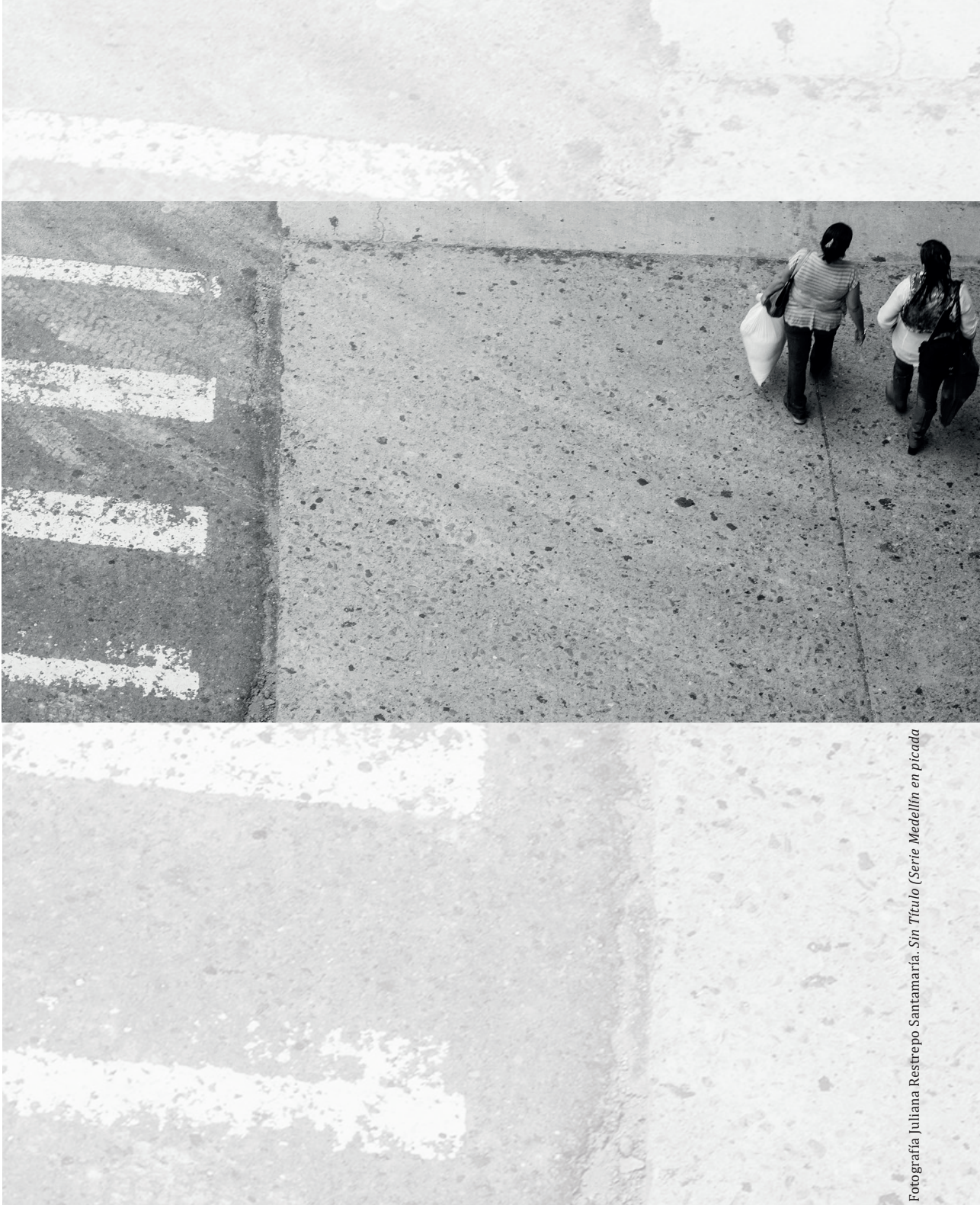
Sin Título (Serie Medellín en picada)